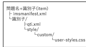
図 1 QTI アイテムの構造

QTI は、難解であり一通りの仕様を理解するのが大変困難な仕様である。そのため今回は、概説として、QTI における単純な問題の記述形式について説明することとする。