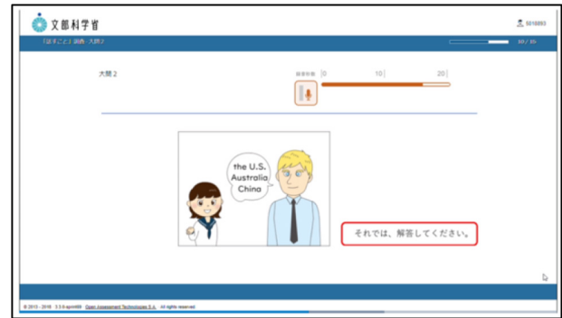
図4 文部科学省「英語予備調査」CBT 画面 Figure 4 Ministry of Education “English Pre-Survey” CBT Screen Capture

QTI を活用した事例に、文部科学省「英語予備調査」[8]がある。本調査は、CBT を活用し 136 の学校、約 2 万人の中学校 3 年生に対して英語スピーキングのテストを、学内のコンピュータを利用して実施された。