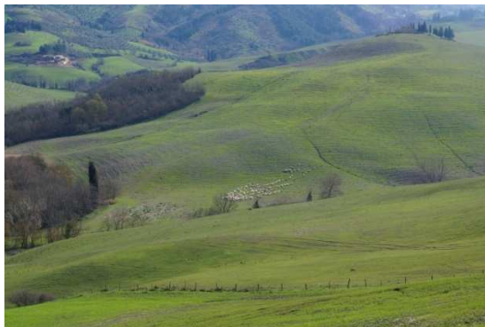
写真 10 リスケット牧場 8

リスケット社の敷地面積は 240 ヘクタールである。牧草地、羊舎、チーズ工房、アグリツーリズム(宿泊施設)、レストラン、オフィス、および従業員宿舎がある。