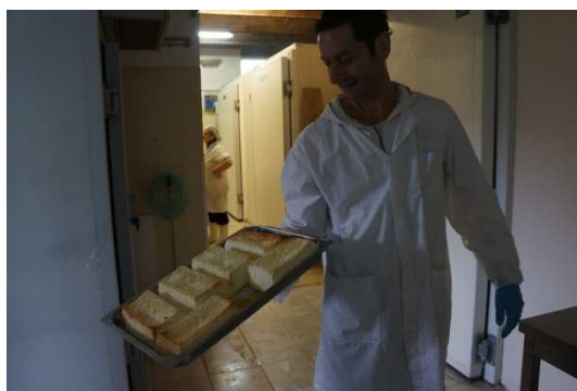
写真9 オリジナル商品:トレコッタ

トレコッタ (Trecotta) というオリジナル商品を開発した。リコッタの注水量によって供給が需要を上回った場合、リコッタを 200 度のオーブンに 2 時間半入れる。リコッタは「2 度(re)火を入れる(cotta)」ことからつけられた名称なので、リスケット社はこの「3 度(tre)火を入れる(cotta)」オリジナルチーズに「トレコッタ」というネーミングをつけた。よく似たチーズとしてリコッタ・アッフミカータ(ricotta affumicata)があるが、アッフミカータは燻製なので違うタイプのチーズである。