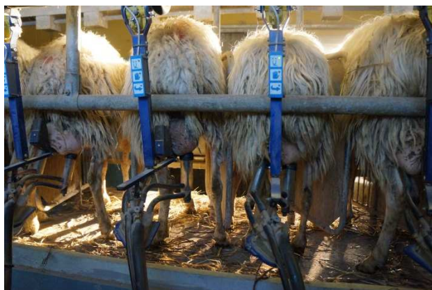
写真 2 搾乳 6