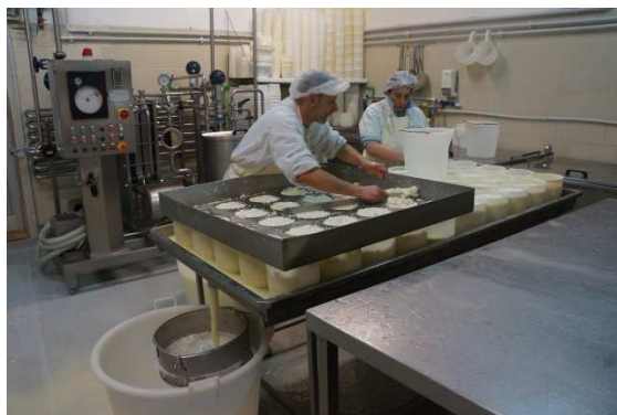
写真6 カードをフォルマに入れる