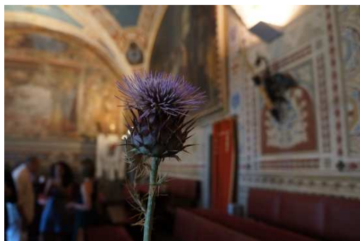
写真3 ペコリーノ・バルツェの酵素:野生のアーティチョーク