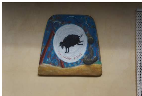
写真 11 反骨精神(Spirito Ribelle)ペコラ・ネロ

チーズのペコラネラをはじめ、オリジナルブランドの化粧品やワインに黒羊をデザインしたエチケット(ラベル)を使っているのはカンナス氏がペコラ・ネロ(pecora nero: 黒羊)だからである。ペコラ・ネロは「はぐれもの」や「はみ出し者」といった異端児という意味である。「でも誰もが黒い羊の精神を持っているはず。誰もが反骨(rebellious)、すなわち権威や権力や時代の風潮に逆らう気骨を持っている」とカンナス氏は述べ 9 、「他人とは違う方向に向かって行くのが自分」と言う。