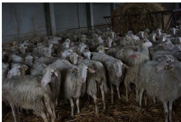
写真 1 搾乳を待つ羊

酪農を担当しているのはバングラディッシュとアルメニアからの外国人 2 人である。バングラディッシュ人の青年が「この仕事は 365 日休みがないし、埃まみれになるから辛い」と言うように、酪農は厳しい労働を伴う仕事である。カンナス氏自身も酪農の仕事をしている若いころ、26 歳までイタリア人やトスカーナ出身のガールフレンドは 1 人もいなかった。彼女はいつも外国人だった。なぜならば酪農家は女性から最も好かれぬ職業だからである。社会的地位が低いと考えられている。女性たちは銀行員や医師と一緒になりたがっている。