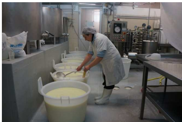
写真8 リコッタ作り 7