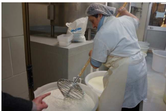
写真5 スピーノで凝乳を攪拌する

凝乳をナイフでカットし、スピーノ (spino) と呼ばれる攪拌器具で粒状に砕いていくとカード (Cagliata: 凝固物) と乳清 (ホエイ) に分かれる [写真5]。